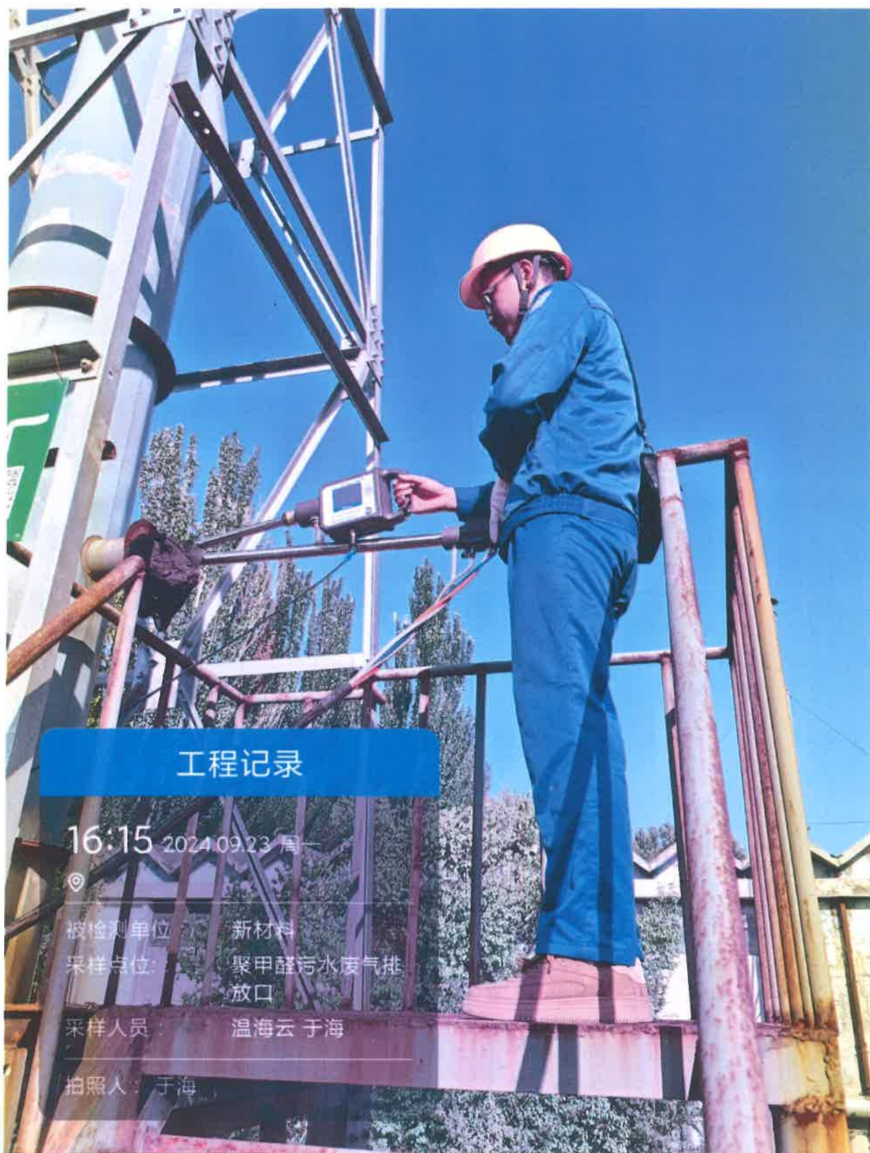
图 1 聚甲醛污水处理排口采样点位照片