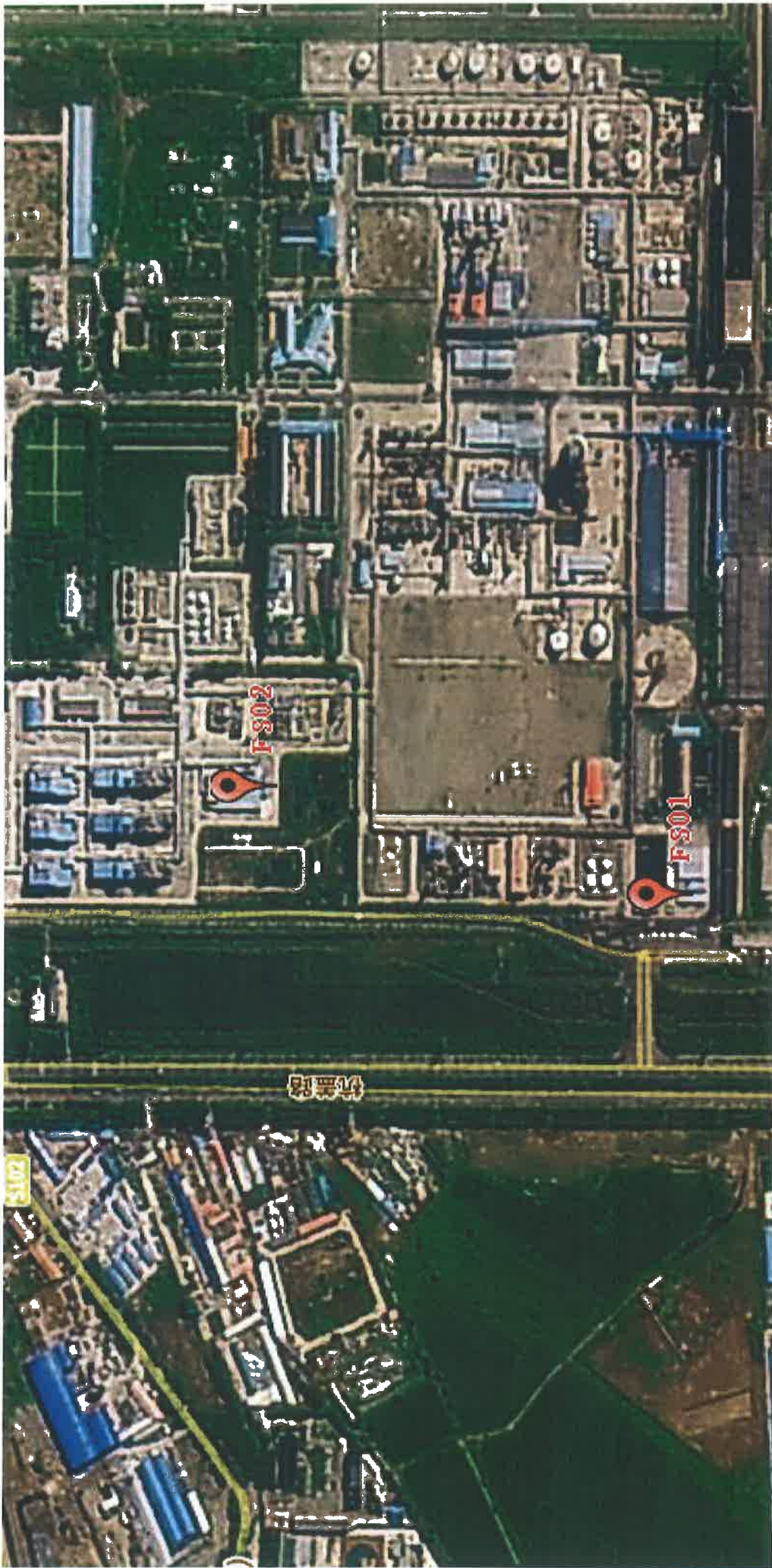
图 2 废水检测点位示意图