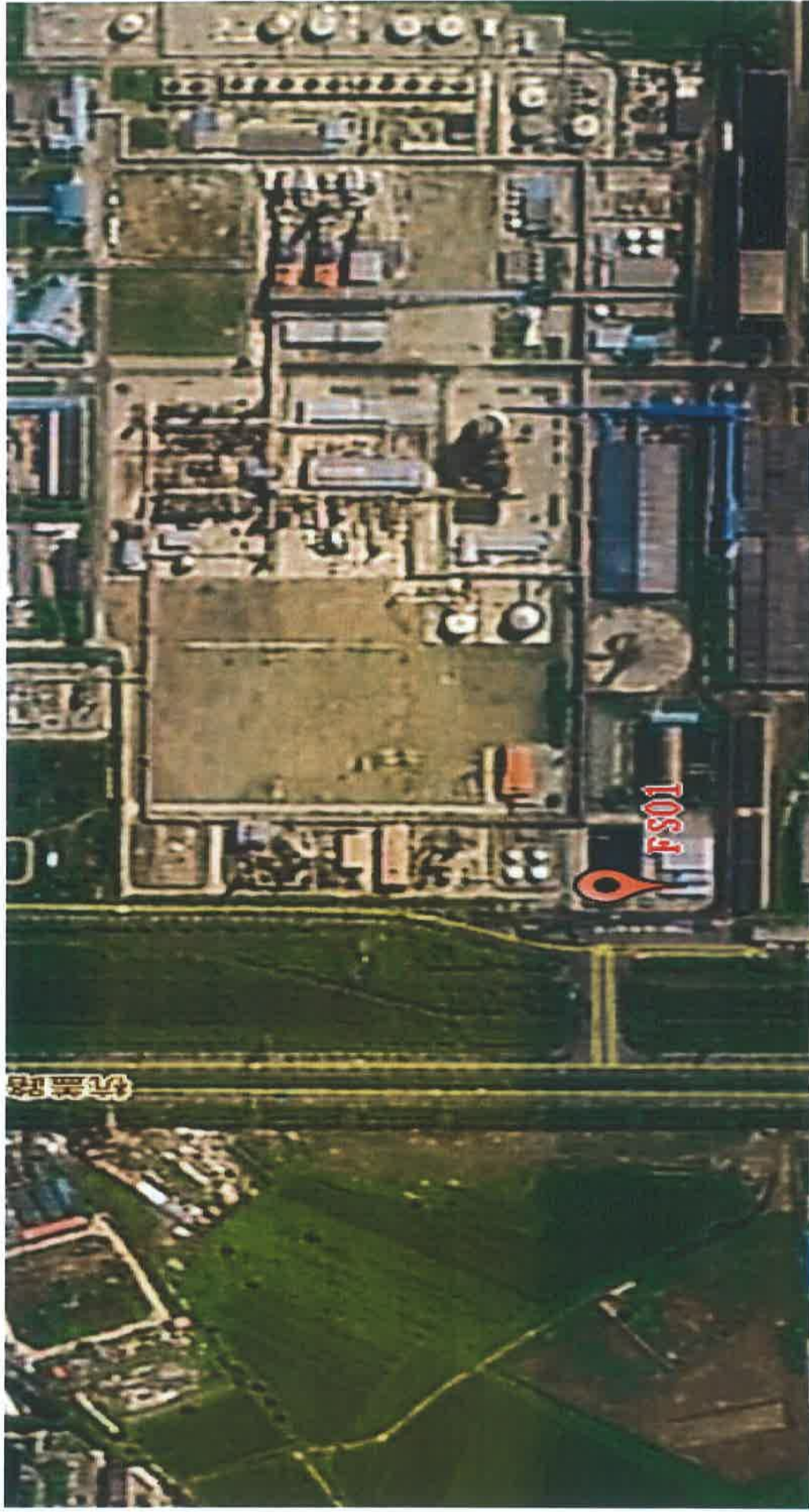
图2 废水检测点位示意图