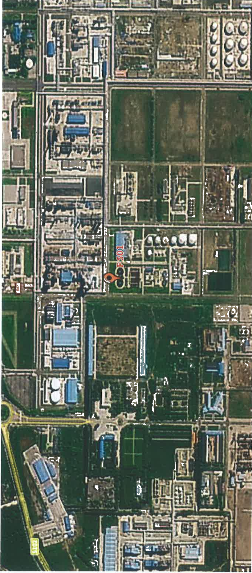
图 2 检测点位示意图