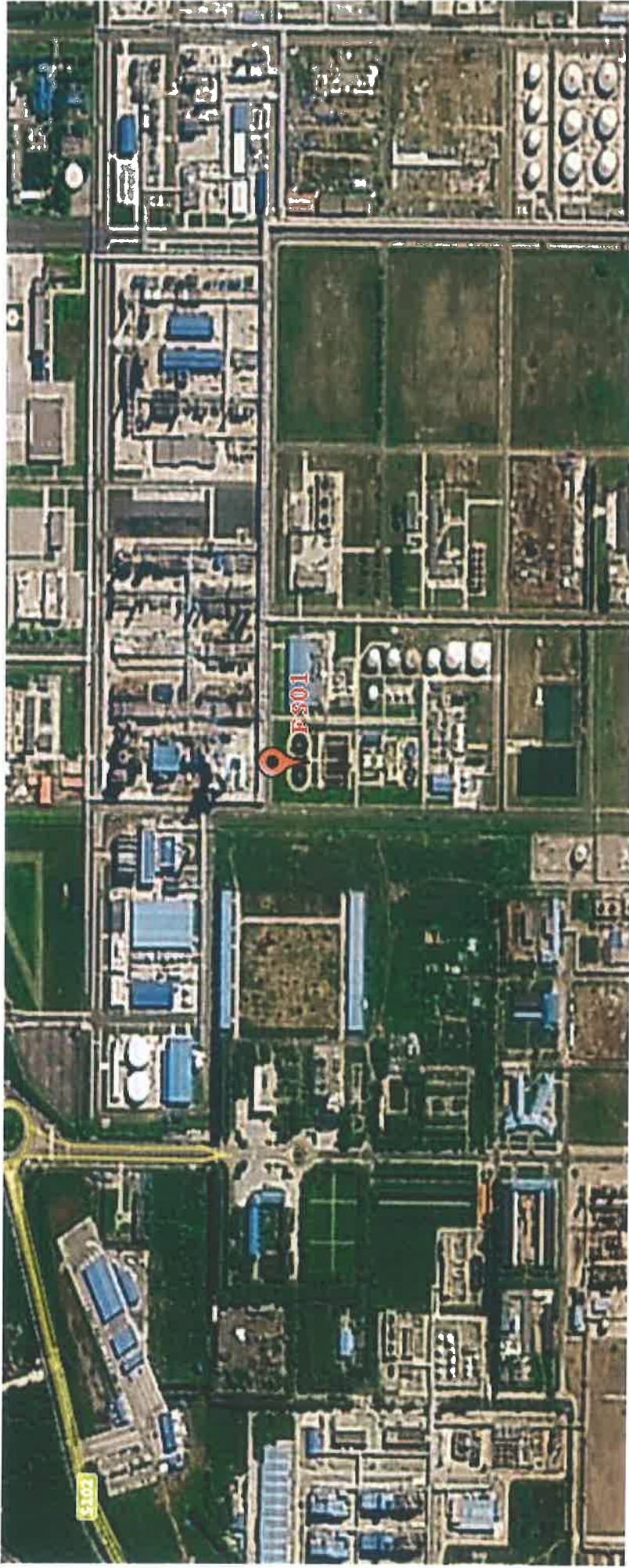
图 2 检测点位示意图