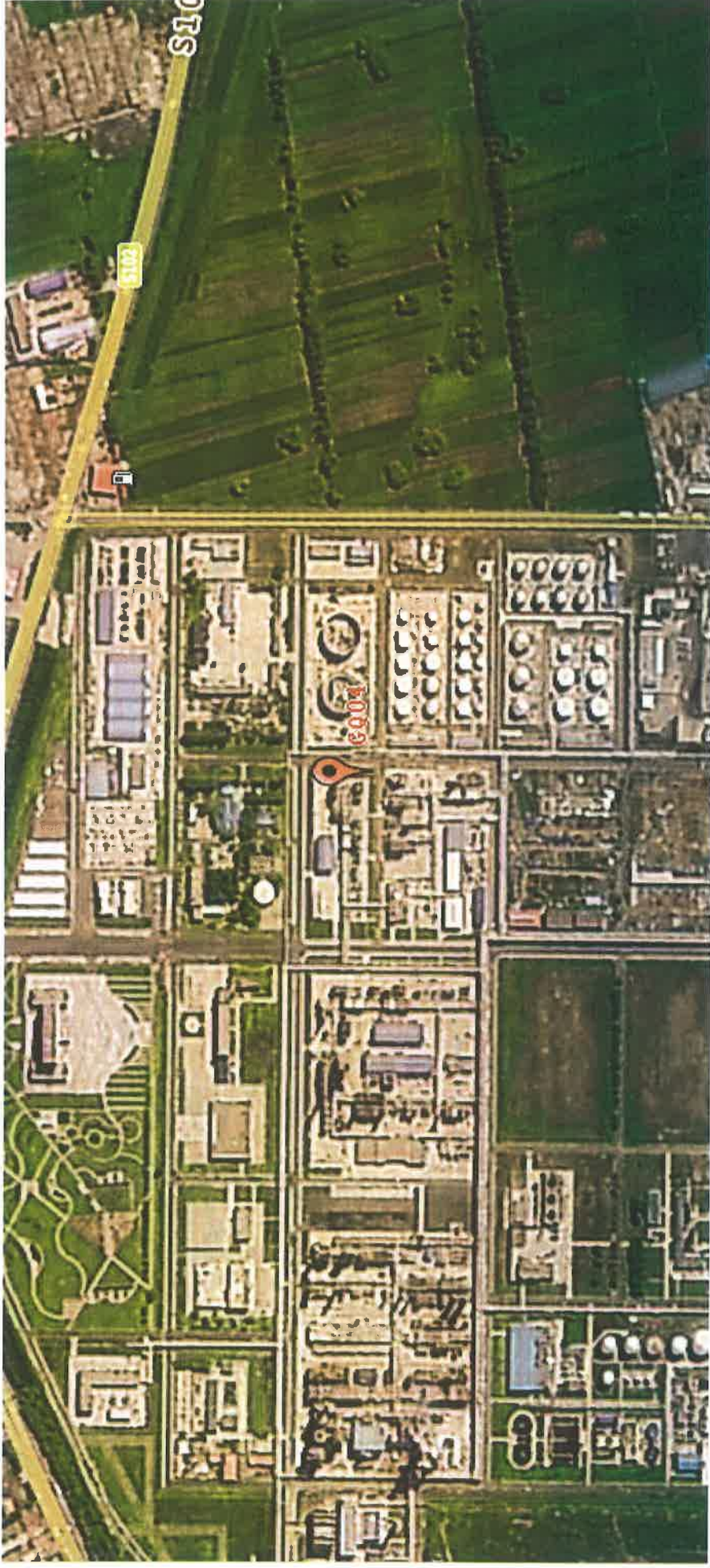
图 2 检测点位示意图