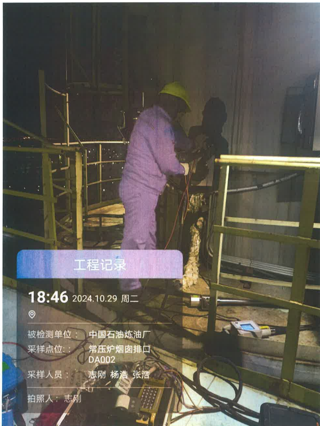
图 1 采样点位照片