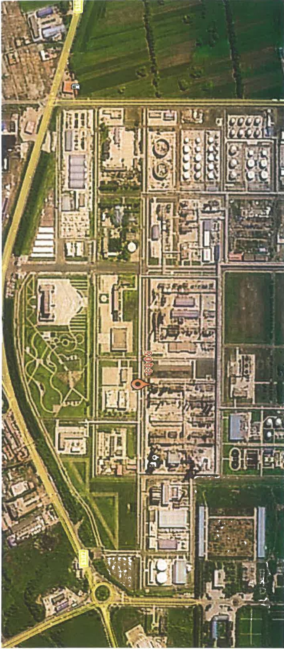
图2 检测点位示意图