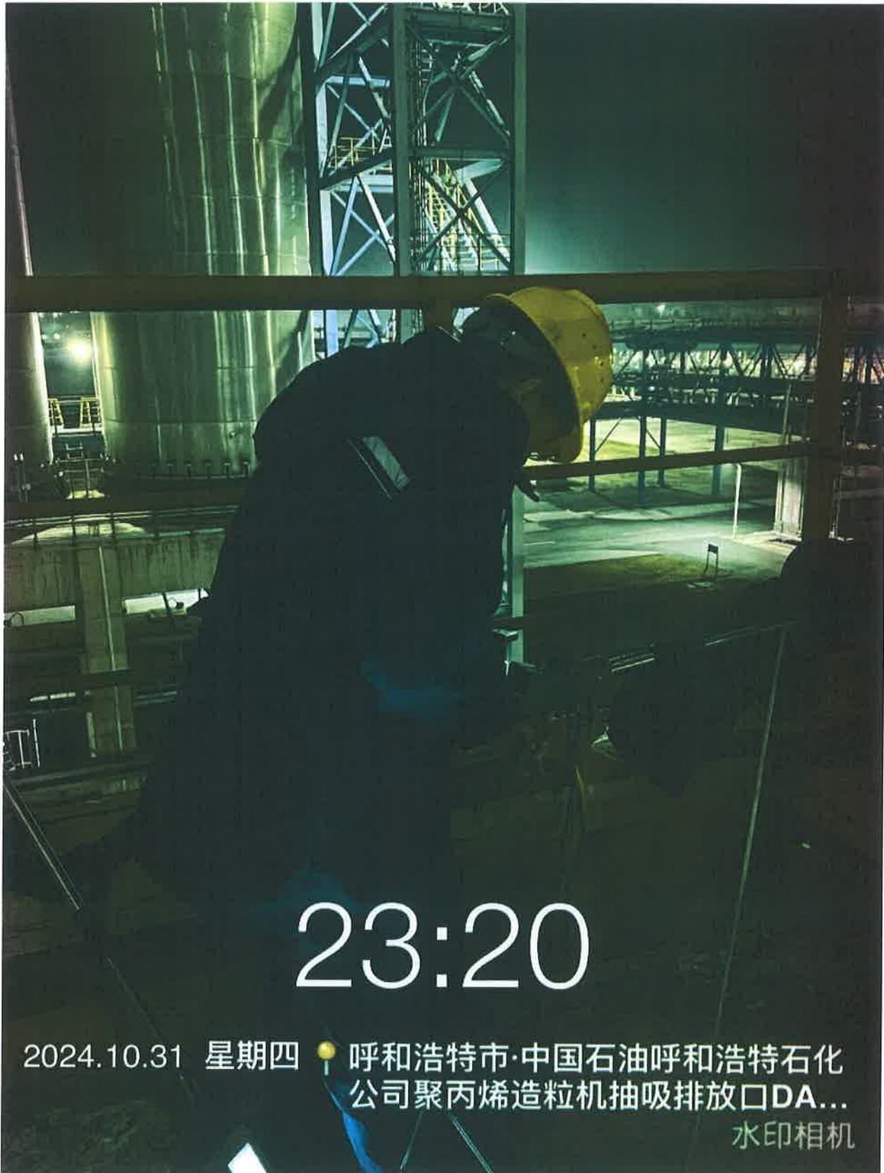
图 1 聚丙烯造粒机抽吸系统点位照片