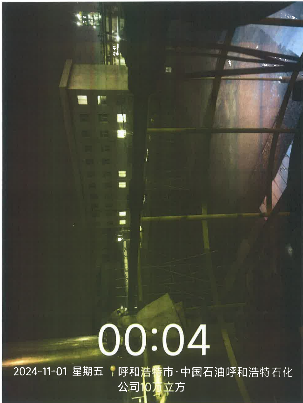
图1 10万立污水池废气处理设施排放口采样点位照片