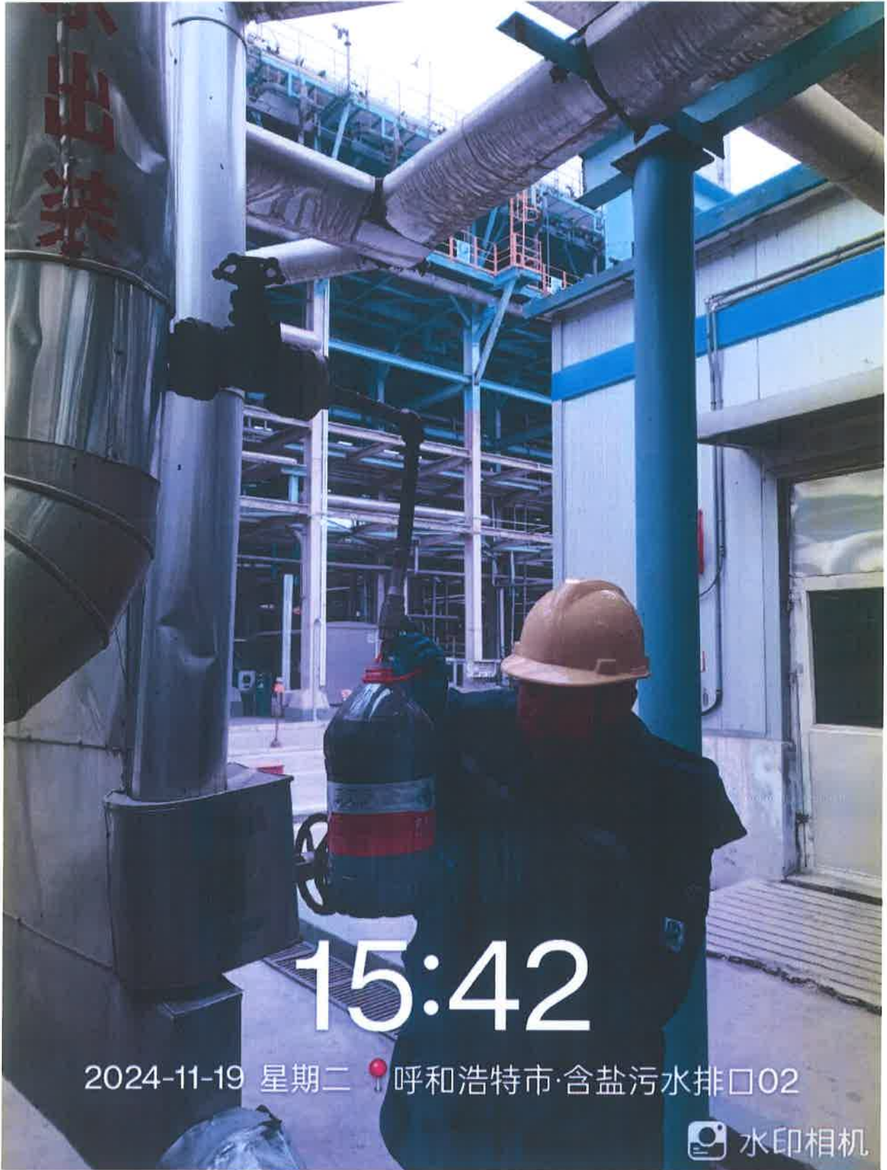
图 1 采样点位照片