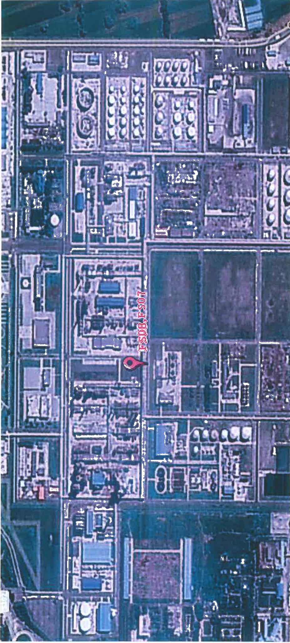
图 2 采样点位示意图